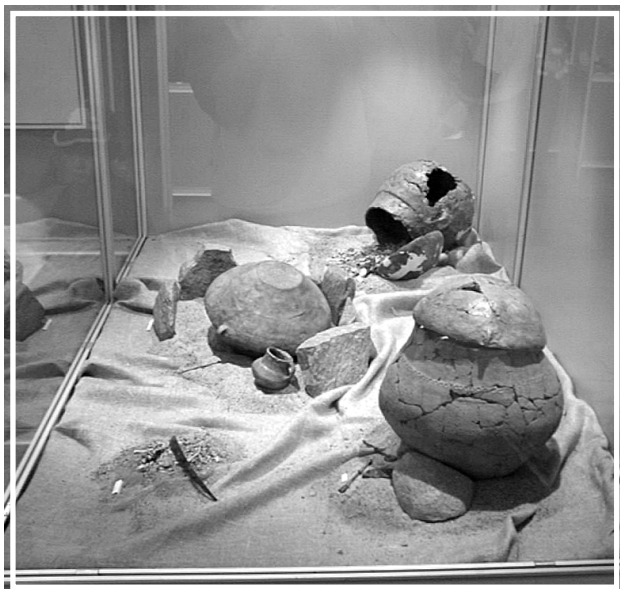
Groby popielnicowe i jamowe